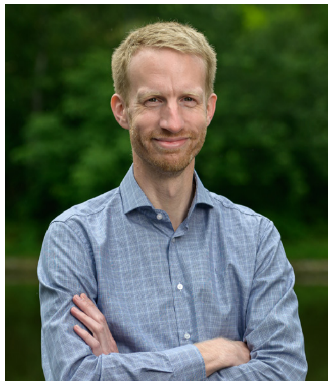
Jan Adamec, starosta Prahy 12

Nejvíce mi záleží na vzdělávání. Věřím, že vzdělání je klíčovým prvkem pro budoucnost. Přitom nevíme, jaká ta budoucnost bude. A školy nás musí připravovat tak, abychom byli schopni