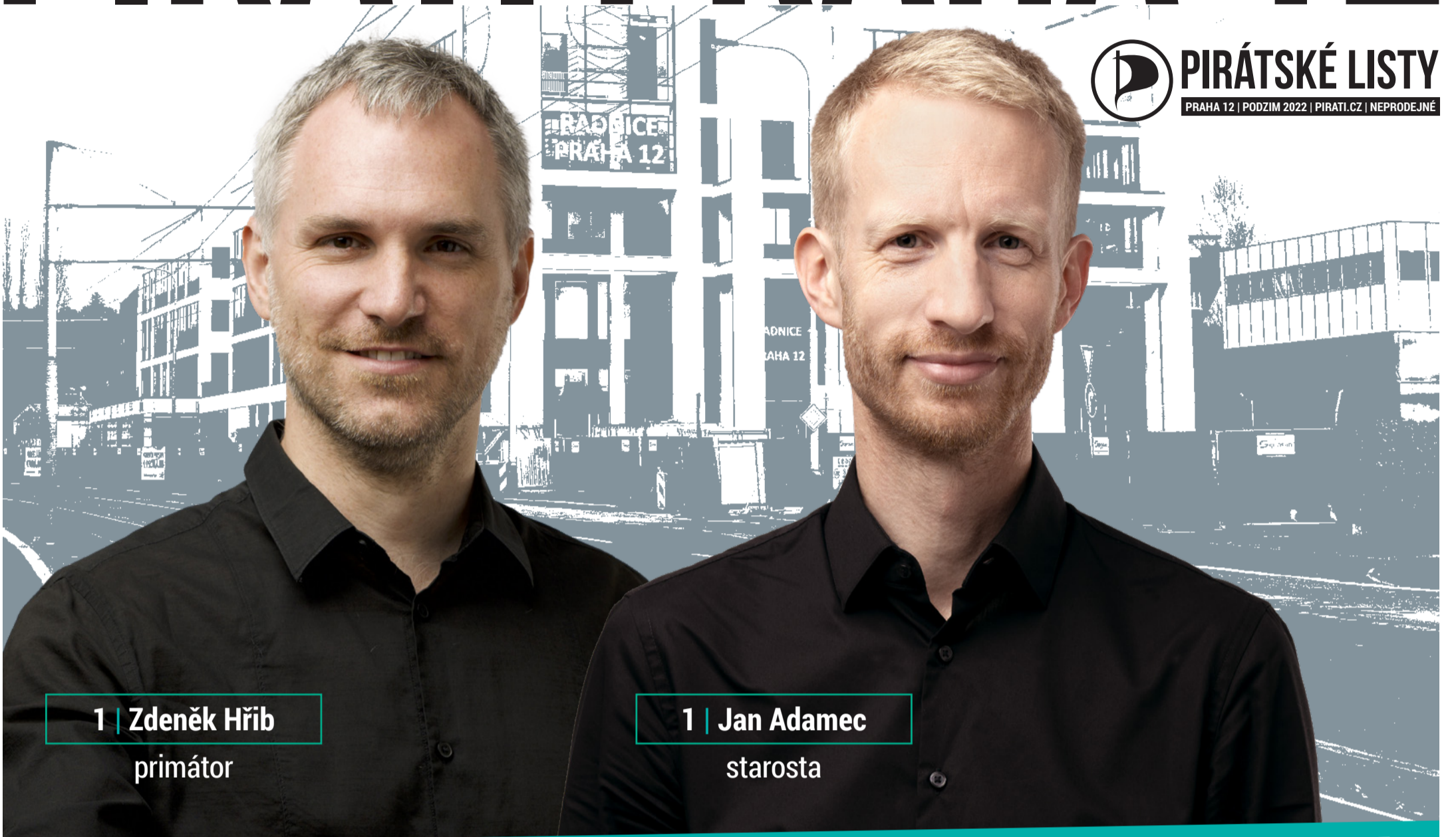
1 | Zdeněk Hřib primátor

PRAHA 12 | PODZIM 2022 | PIRATI.CZ | NEPRODEJNÉ